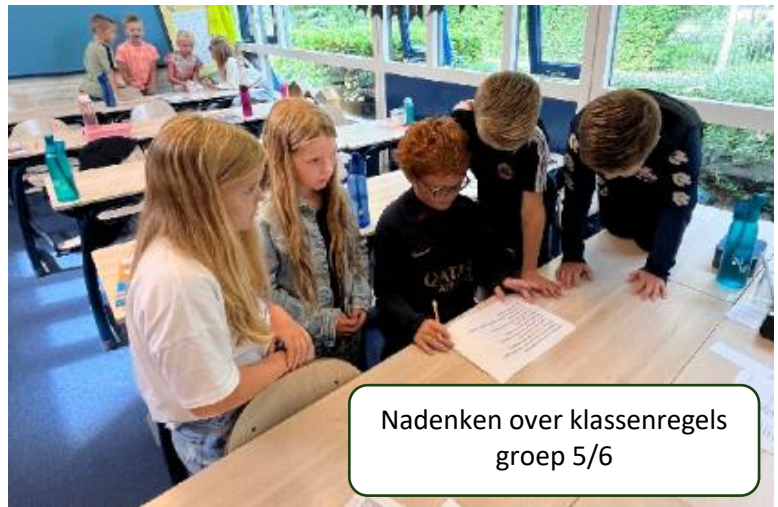
Nadenken over klassenregels groep 5/6