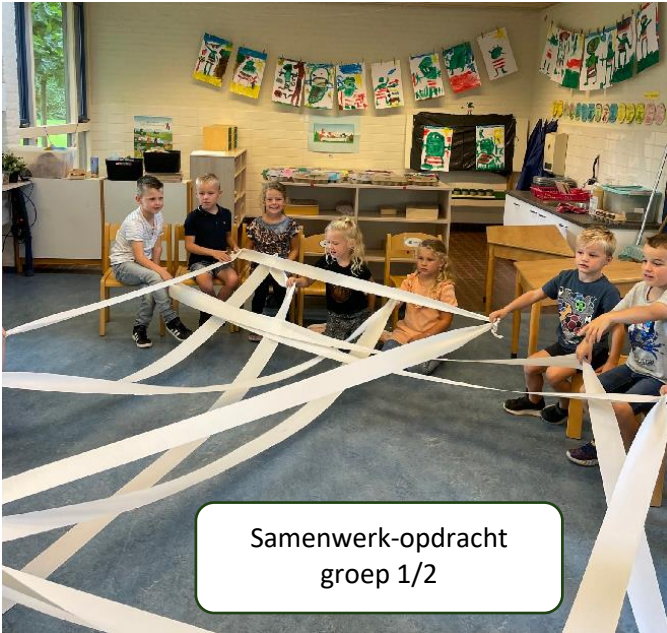
Samenwerk-opdracht groep 1/2

Graag geven wij u een impressie van een aantal lesactiviteiten uit de achterliggende weken: