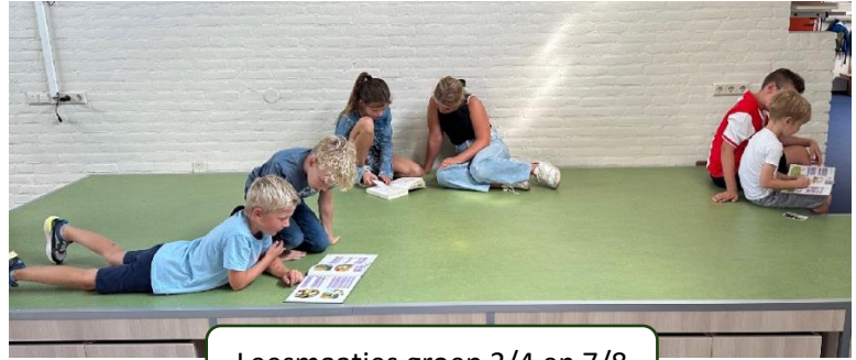
Leesmaatjes groep 3/4 en 7/8